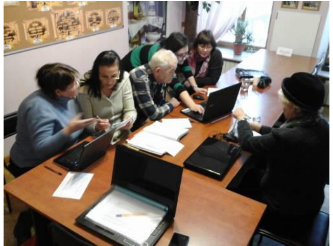
На фото: работа клуба «On-line» в ЦНК «Widerstrahl», г.Киев.

В ноябре 2016 года в Центре немецкой культуры «Widerstrahl» (г.Киев) стартовали занятия в клубе «On-line», на занятиях которого сеньоры- члены общества имеют возможность получить базовые знания и навыки работы с текстами, таблицами, изображениями, научиться создавать и отправлять электронные письма и смс (в случае работы с мобильным телефоном). В планах клуба - освоение работы с браузерами поиска информации в интернете, установка, переписка и звонки в Skype, Viber, Whatsapp, а также создание страниц в социальных сетях.