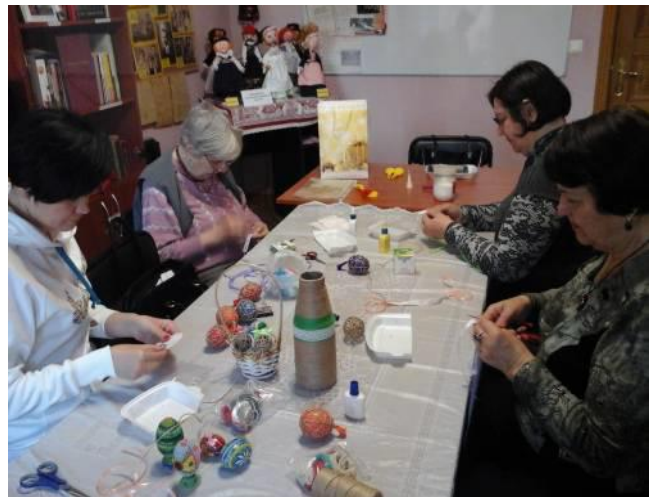
На фото: работа клуба «Hand-Machen» в ЦНК «Widerstrahl», г.Киев.

Творчість та рукоділля - одні з давніх німецьких традицій. Батьки сідали з дітьми та разом майстрували поробки та прикраси до кожного свята. От і ми збираємось кожної п'ятниці та навчаємось робити гарні, корисні та оригінальні подарунки до свят та урочистих подій.