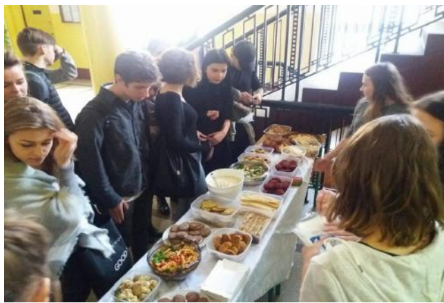
На фото: благодійний ярмарок в ліцеї.

Волонтерські роботи організують як і для нашого ліцею, так і для цілого міста, як от зараз - підлітки Вроцлава допомагають в організації "The World Games 2017". Також, цікаво, що волонтерство спрямоване не тільки для допомоги: дітям, пенсіонерам та тваринам, або для навчання: проведення майстер-класів, лекцій, міських конкурсів, а й задля розваги, тобто для проведення різдвяних лотерей, ярмарків солодощів, та навіть проведення кібер-турнірів.