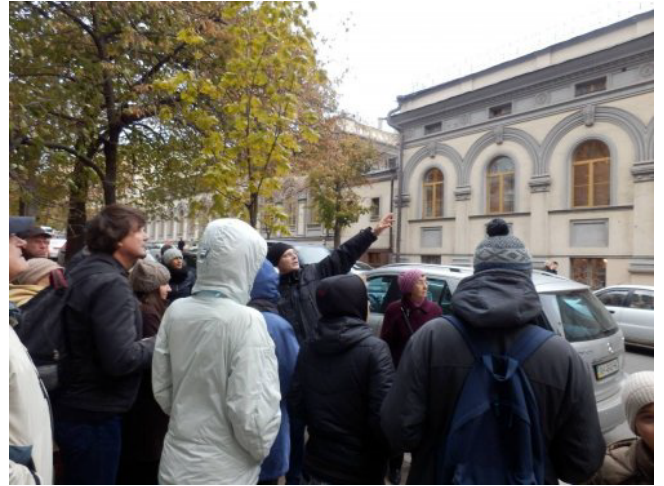
На фото: экскурсия для этнических немцев г.Киева.

Образовательные программы адаптированы специально для работы с людьми старшего возраста. Кроме учебных занятий проводятся экскурсии по историческим и культурным местам.