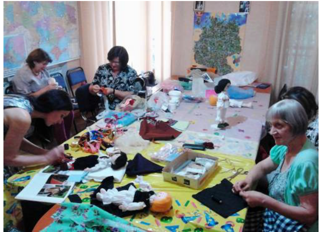
На фото: работа клуба «Wir nähren Nationaltracht» ЦНК «Widerstrahl» г.Киев.